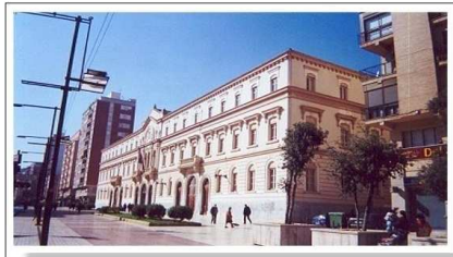
Benvingut/da a l'Institut Francesc Ribalta. Castelló

Informació Ceef (Ibae) Nocturn Cicles Departaments Seminaris Tauler Exalumnes Ampa