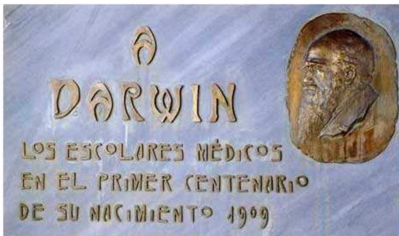
Fig. 2: Placa commemorativa del primer centenari del naixement de Darwin, de marbre i bronze, oferta pels estudiants de la Facultat de Medicina de València, que actualment es conserva en el Museu d'Història de la Medicina i de la Ciència de València.