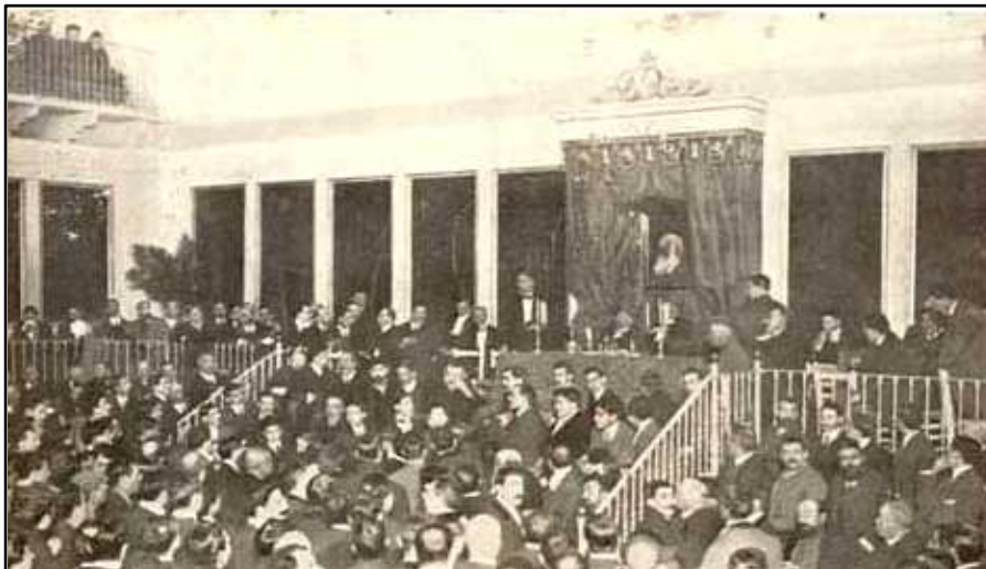
Fig. 1: Fotografia, apareguda en la premsa gràfica de l'època, de l'homenatge públic a Darwin en el Paranimf de la Universitat de València, amb motiu del primer centenari del seu naixement, organitzat en 1909 a proposta d'un grup d'estudiants de medicina.